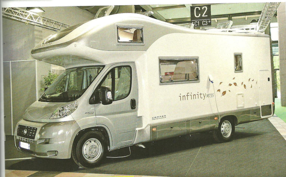
Il mansardato Infinity M735 di Camper Monoscocca